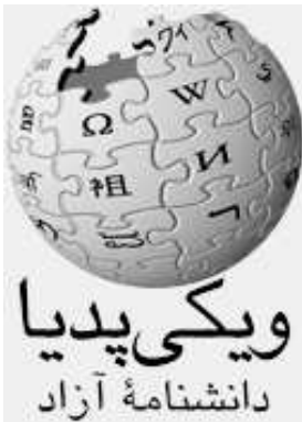
نشان ویکی‌پدیای فارسی